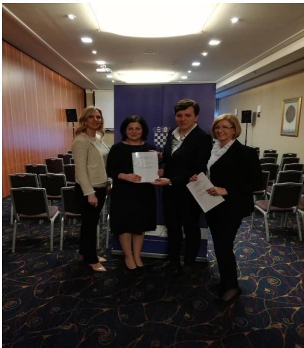
Potpisivanje Ugovora s Ministarstvom turizma